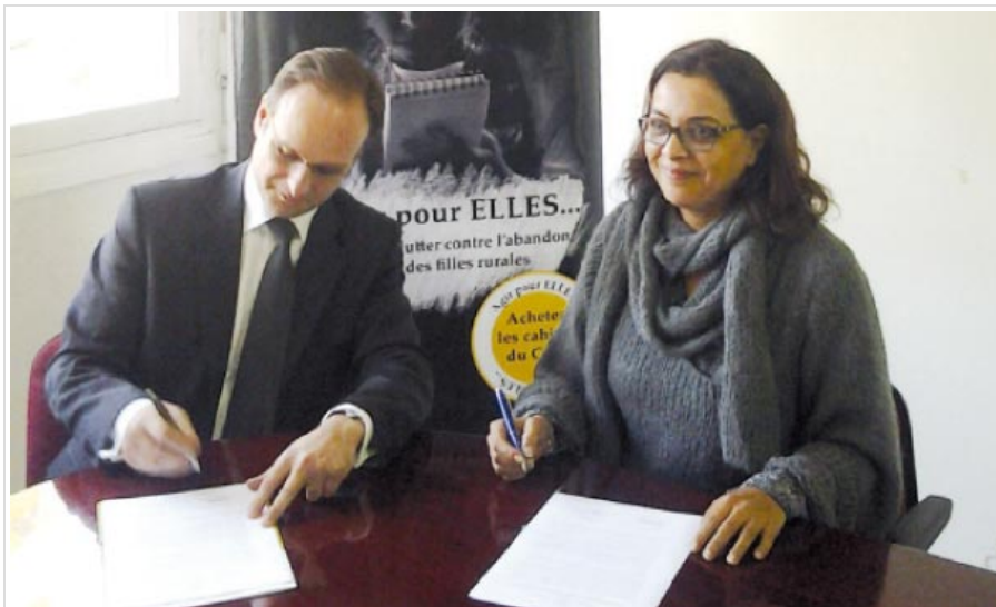
Une des solutions est de mettre en place et surtout de généraliser des services de soutien social.

Publié le : 11 décembre 2013 - Elimane Sembène, LE MATIN