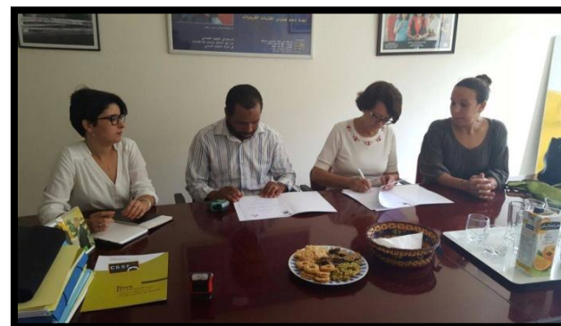
Signature de la convention de partenariat CSSF – Association Almaghrib Aljadid

Grâce au soutien de l'Association RIM, le CSSF s'apprête à ouvrir un nouveau foyer dans la commune rurale d'Asni située dans la région de Marrakech Tensift El Haouz pour l'année scolaire 2016 -2017.